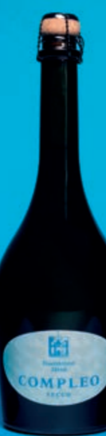
Compleo SECCO, VDP