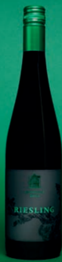
2023 Sortenrein Riesling RIESLING, AOC ZÜRICH