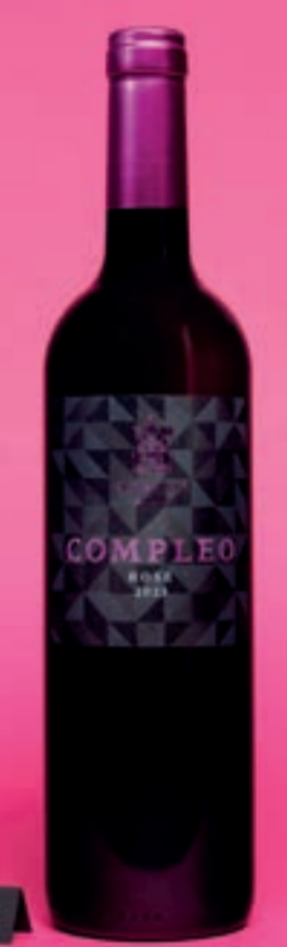
2023 Compleo ROSÉ, VDP