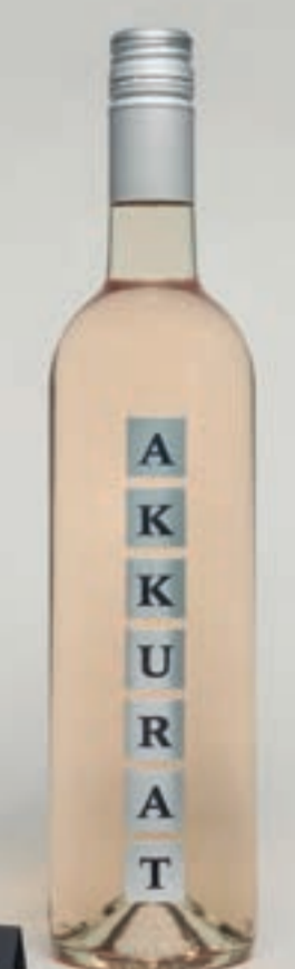
2022 Akkurat WEISS, VDP