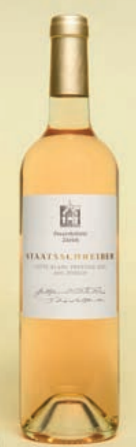
2023 Staatschreiber CUVÉE BLANC PRESTIGE, AOC ZÜRICH