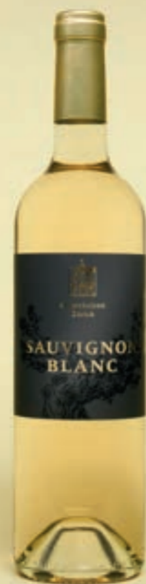
2023 Sortenrein Sauvignon Blanc SAUVIGNON BLANC, VDP