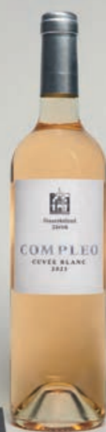
2023 Compleo CUVÉE BLANC, VDP