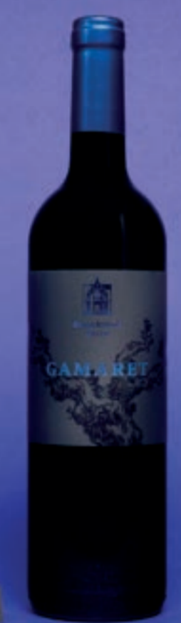
2022 Sortenrein Gamaret GAMARET, AOC ZÜRICH