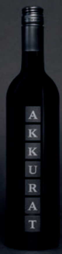
2022 Akkurat ROT, VDP