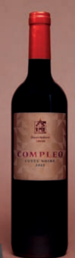
2022 Compleo CUVÉE NOIRE, VDP