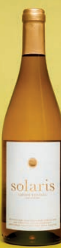
2023 Solaris BIODYNAMISCH NACH DEMETER, AOC ZÜRICH