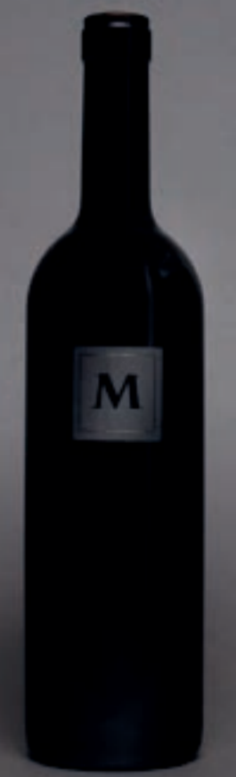
2019 «M» MERLOT, AOC ZÜRICH