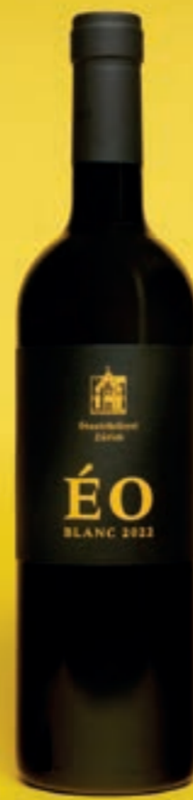
2022 ÉO BLANC, VDP