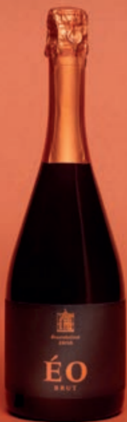
2020 ÉO Brut SCHAUMWEIN, AOC ZÜRICH