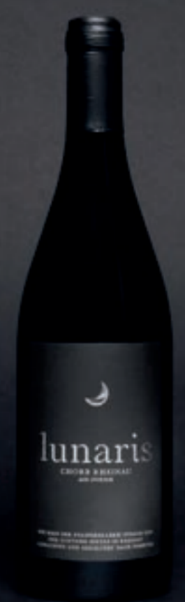
2021 Lunariss BIODYNAMISCH NACH DEMETER, AOC ZÜRICH