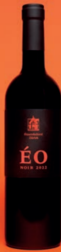
2022 ÉO NOIR, VDP