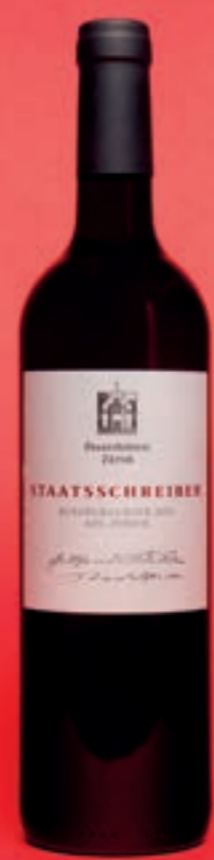
2023 Staatschreiber BLAUBURGUNDER, AOC ZÜRICH